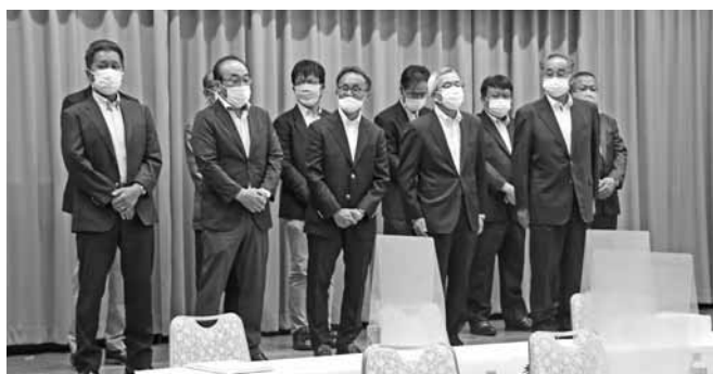
新三役・委員長紹介

全員マスクを着用して、隣との席間隔を広く取った総代会となったため、人物の特定が困難で、異様な雰囲気の中で開催されました。